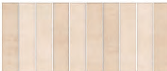
COLOR DEC. LISTELLI BEIGE 25x60 M.CO103