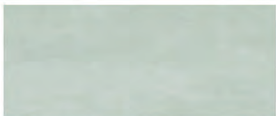
COLOR SALVIA 25x60 M.CO006