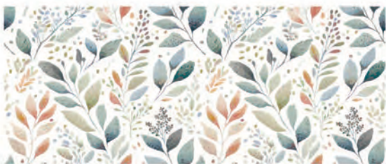
COLOR DEC. MIX 25x60 M.CO00238