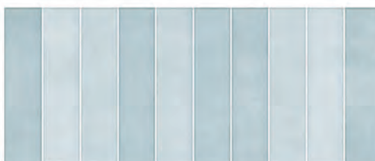
COLOR DEC. LISTELLI AZZURRO 25x60 M.CO107