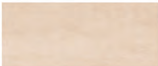
COLOR BEIGE 25x60 M.CO003