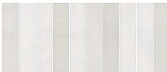
COLOR DEC. LISTELLI GRIGIO 25x60 M.CO105