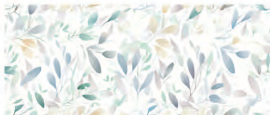
COLOR DEC. SPRING 25x60 M.CO257