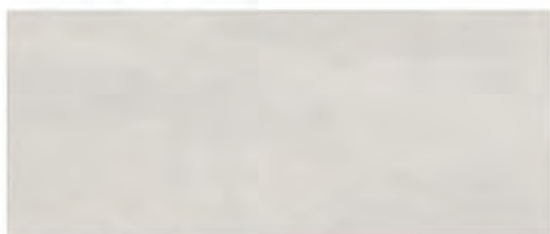
COLOR GRIGIO 25x60 M.CO005