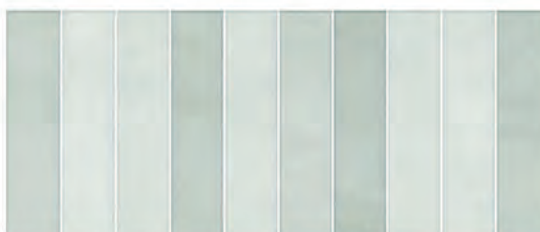
COLOR DEC. LISTELLI SALVIA 25x60 M.CO106