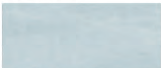
COLOR AZZURRO 25x60 M.CO007